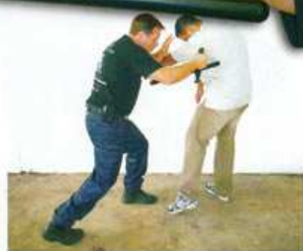
Riposte avec le talon