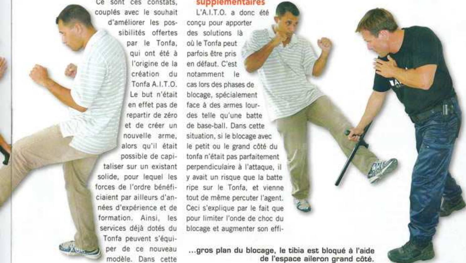
...gros plan du blocage, le tibia est bloqué à l'aide de l'espace aileron grand côté.

Ce sont ces constats, couplés avec le souhait d'améliorer les possibilités offertes par le Tonfa, qui ont été à l'origine de la création du Tonfa A.I.T.O. Le but n'était en effet pas de repartir de zéro et de créer une nouvelle arme, alors qu'il était possible de capitaliser sur un existant solide, pour lequel les forces de l'ordre bénéficiaient par ailleurs d'années d'expérience et de formation. Ainsi, les services déjà dotés du Tonfa peuvent s'équiper de ce nouveau modèle. Dans cette