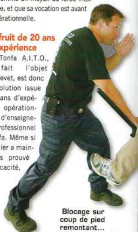
Blocage sur coup de pied remontant...

Le nouveau Tonfa « A.I.T.O. » mis au point par Thierry Delhief peut être porté au ceinturon de façon traditionnelle, grand côté vers le bas le long de la jambe, comme l'illustre ici cette femme fonctionnaire de Police Municipale.