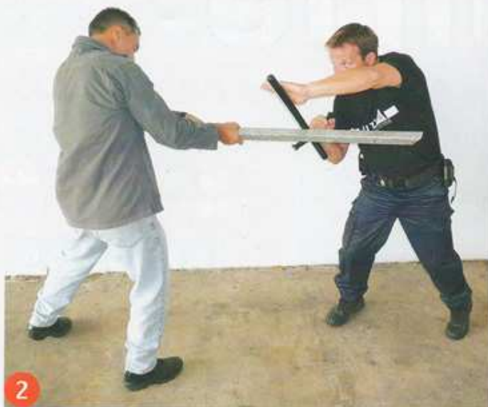
2 ..., bloquer à l'aide de l'espace aileron grand côté, la main réactive venant en renfort.