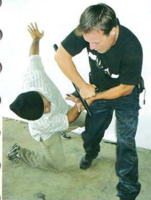
7 ..., afin de provoquer une hyper flexion du poignet pour amener au sol votre adversaire.