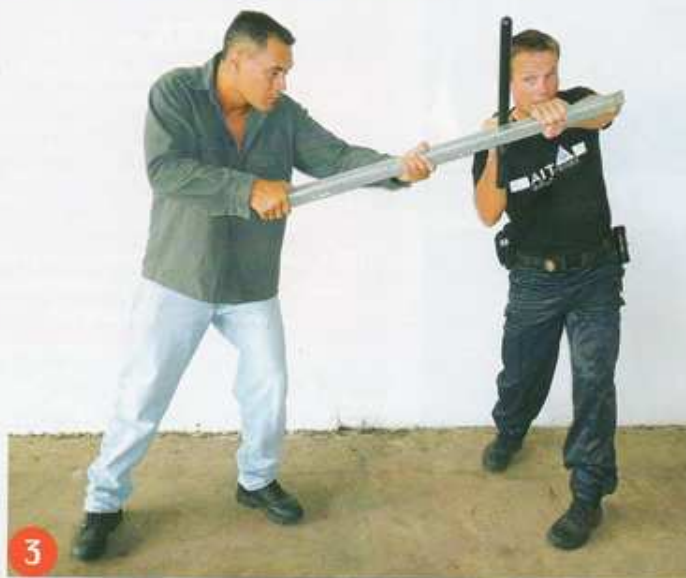
3 Se saisir immédiatement après le blocage de la batte à l'aide de sa main réactive, ... Plusieurs options de désarmement s'offrent alors à l'opérateur :