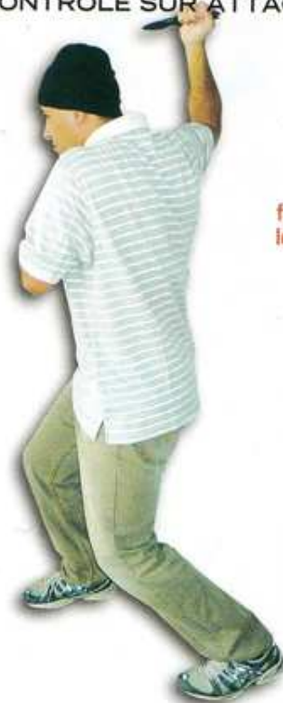
2 ..., bloquer le bras armé dans l'espace formé entre le petit côté et l'aileron