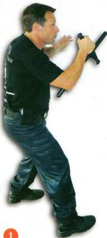
1 Sur une attaque circulaire, ...

PARADE / DÉARMEMENT / CONTRÔLE SUR ATTAQUE CIRCULAIRE AU COUTEAU