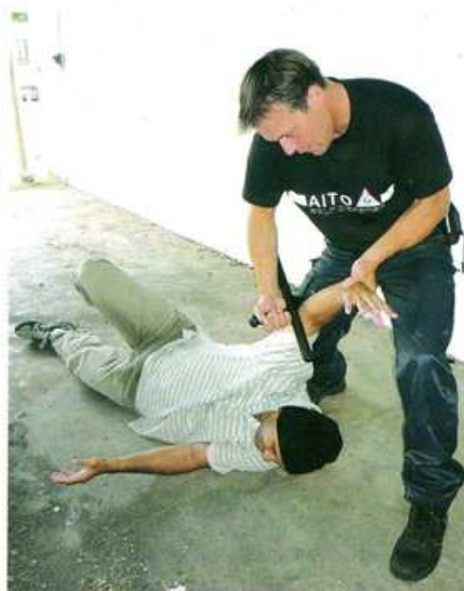
8 Maintenir son poignet et venir placer l'aileron au dessus du coude...